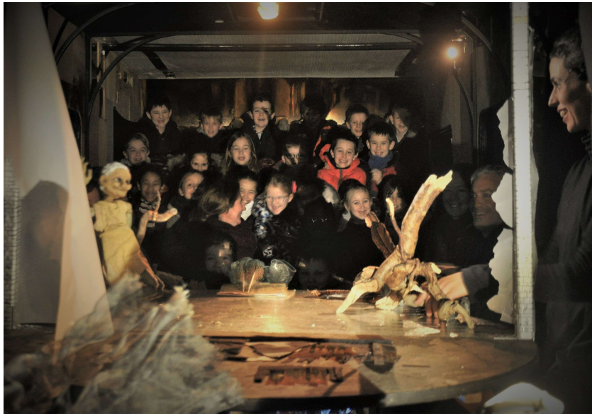
La caravane-théâtre peut accueillir une classe d'enfants (28) en représentation scolaire ou 21 personnes en tout public